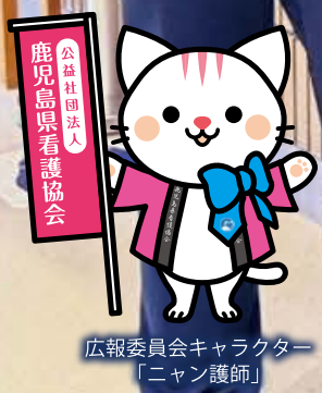
広報委員会キャラクター 「ニャン看護師」