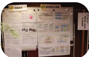
「ちとっばっかい業務改善」掲示