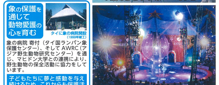
画像はイメージです。 かわいい象さんのショー ワシントン条約により、出演できない場合がございます。予めご了承ください。