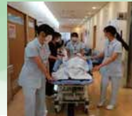
「ふれあい看護体験」