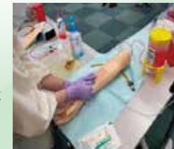
技術支援セミナー