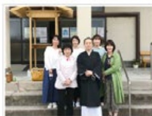
谷山の妙行寺にて メッセンジャーナースの皆さんと