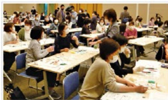
ワクチン接種業務事前研修会 風景

今後は就業支援のための技術研修を受付中で、ホームページに技術研修案内を掲載していますので、お問い合わせください。