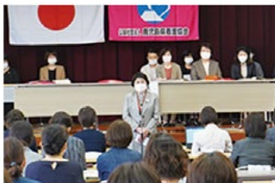
田畑会長あいさつ