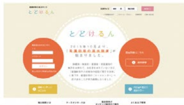
離職看護師等の届出サイト「とどけるん」