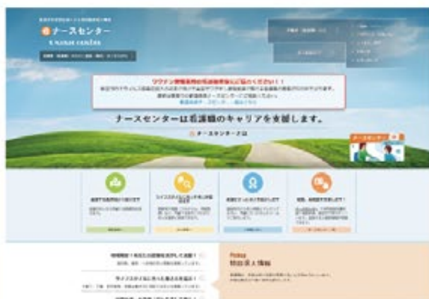
無料職業紹介サイト「eナースセンター」

ワクチン接種に関しては4月の十島村の集団接種に始まり、県内の市町村や鹿児島県の大規模接種会場などで多数の看護職の皆様にご協力をいただき、7月15日までの就業者は106名(内60代20名、70代6名)となりました。今後、集団接種が職域に広がり、若い世代の接種も本格化してまいりますとともに、ますます潜在看護職の皆様のお力が必要となります。新型コロナウイルス感染症の終息に向けて、看護職として自分にできることは何かを考えながら身近な感染対策に取り組んでいただくとともに、潜在看護職として届出登録サイト「とどけるん」への登録、及び無料職業紹介サイト「eナースセンター」へご登録をいただければ幸いです。