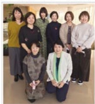
メッセンジャーナースの皆さんと (鹿児島県会員8名)