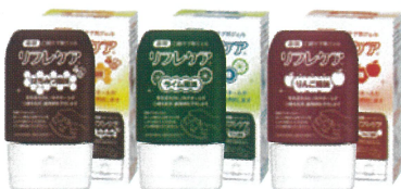
薬用 口腔ケア用ジェル リフレケア

口腔粘膜疾患は急性期、慢性期、終末期患者の何れにも発生する。これらの患者に発症する口腔粘膜疾患には、粘膜炎（口内炎）以外にも多種多様な疾患が存在する。口腔粘膜疾患を理解するうえで最も大事なことは正常な口腔の状態を理解したうえでよく遭遇する口腔粘膜疾患を知ることである。口腔は直視できる臓器であるため見慣れていると考えがちであるが、実際には知っているようで知らないのが口腔粘膜疾患である。本講演では口腔粘膜疾患の発生部位、色、性状（形）に注目した口腔粘膜疾患の見分け方とその対処法について解説する。