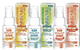
薬用 口腔ケア用ジェル リフレケア