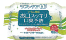
口腔清拭シート リフレケアUW