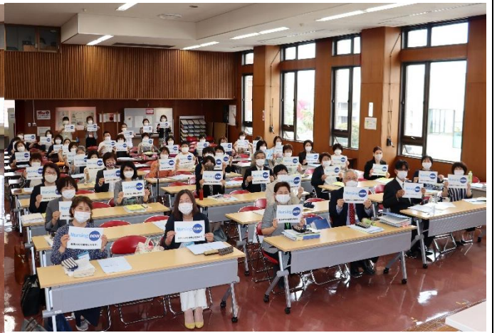
内司常任理事の音頭に合わせて