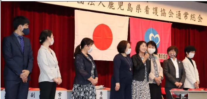
旧理事を代表して下仮屋副会長の挨拶