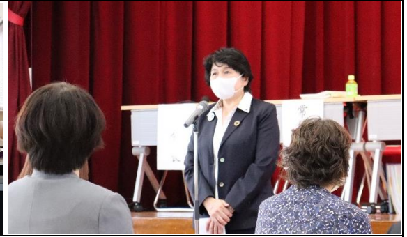
鹿児島県看護協会田畑会長挨拶