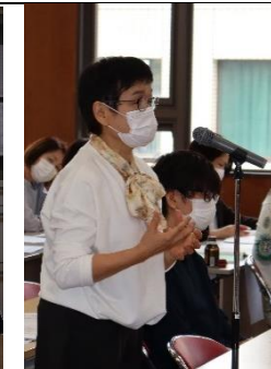
質疑応答・協会への提言ありがとうございました