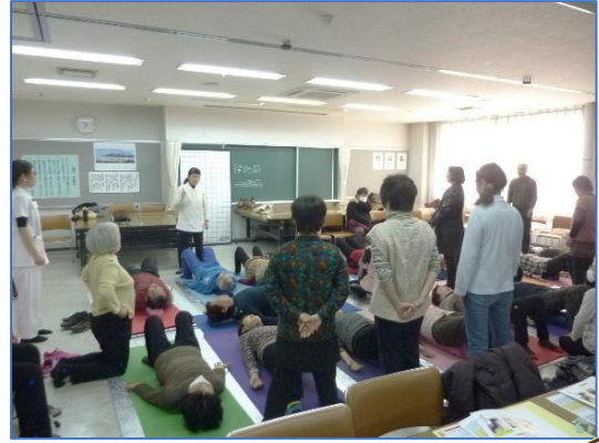
～日置市会場での教室風景～