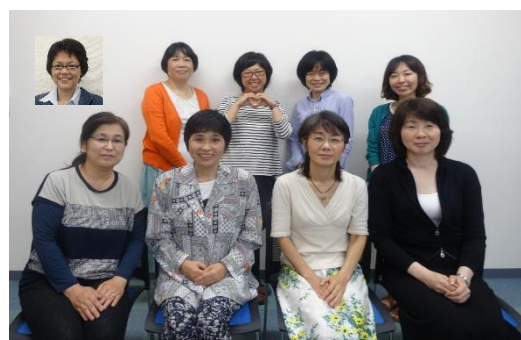
予想外のニュースに、思わず保健師職能委員で写真を撮ってみました☆