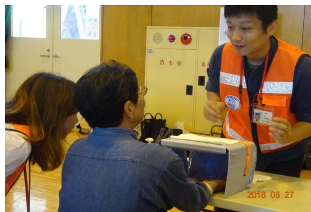
手洗いチェッカーで確認中