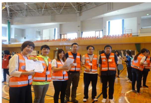
手洗い消毒グループ