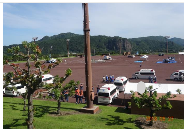
運動場での訓練風景