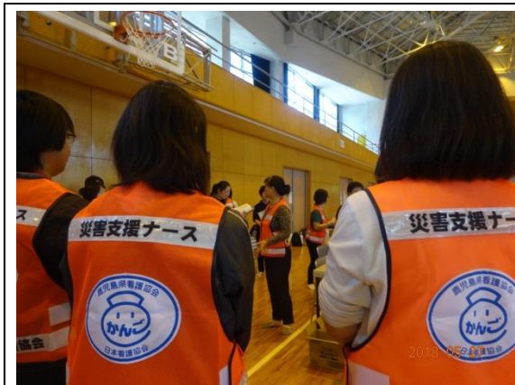
全体オリエンテーション

平成 30 年 5 月 27 日（日）、開聞総合体育館および運動場にて、鹿児島県総合防災訓練が行われました。前日の雨とはうって変わり、晴天の中、災害支援ナース 25 名と災害看護検討委員 8 名、看護協会から 2 名が参加しました。各グループに分かれて、健康相談・感染症予防（汚物の処理、手洗いチェック）・エコノミー症候群予防体操を 20 分ごとにローテーションし、訓練を行いました。健康相談は 60 名、手洗いコーナーは 41 名の住民が手洗いチェッカーに興味を示され、体験していました。