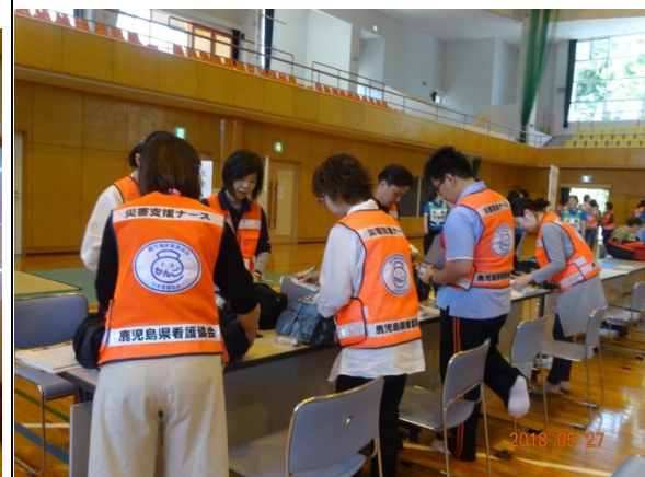
支援ナースバッグの中身チェック