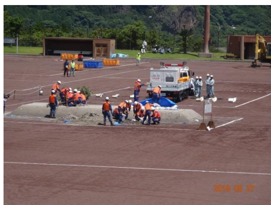
土砂崩れ撤去訓練