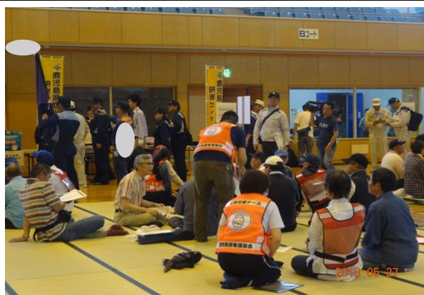
避難者への声掛け