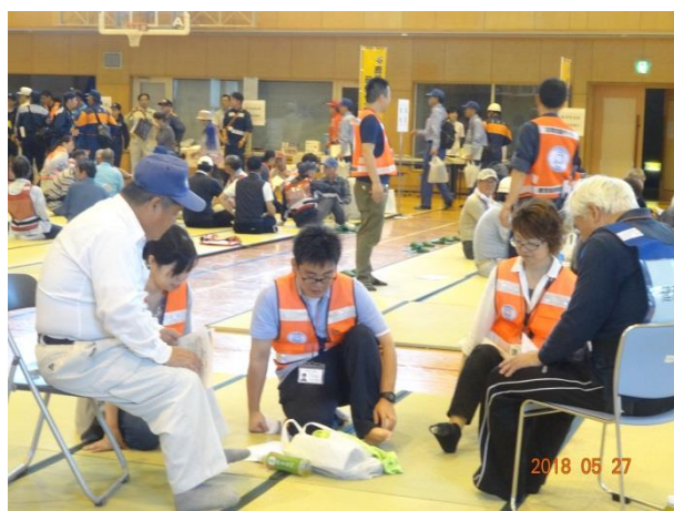
エコノミー症候群予防