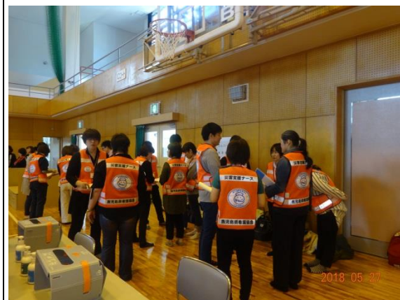
グループごとのオリエンテーション